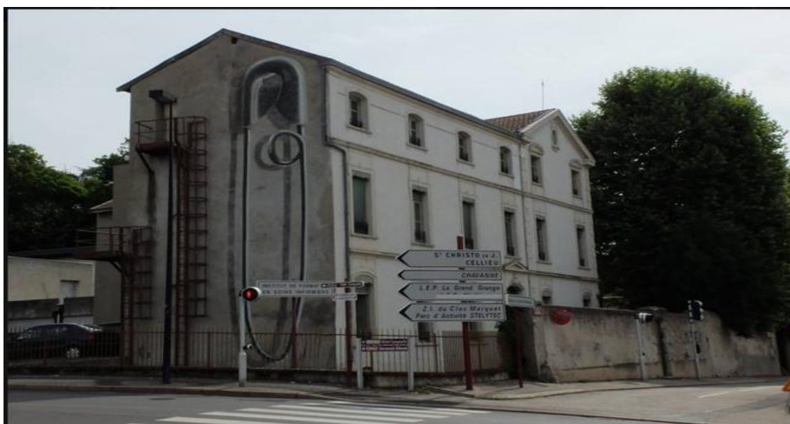
Ecole d'assistants sociaux de Saint-Chamond en 1968 : cette photo est récente, à l'époque, l'épingle à nourrice, pour symboliser les infirmières [!] n'avait encore été peinte

En septembre 1967, à 18 ans, après le bac, j'entre donc dans une école d'assistant de service social, à Saint-Chamond. Elle est dirigée par des religieuses, mais qui appliquent un programme imposé par l'État. Bien qu'en tenue de nonnes (donc voilées, comme c'est le cas également de toutes les infirmières chefs de service à l'hôpital public, toutes religieuses), elles ne font aucun prosélytisme, ont un tel investissement dans la formation, qu'en bien des aspects