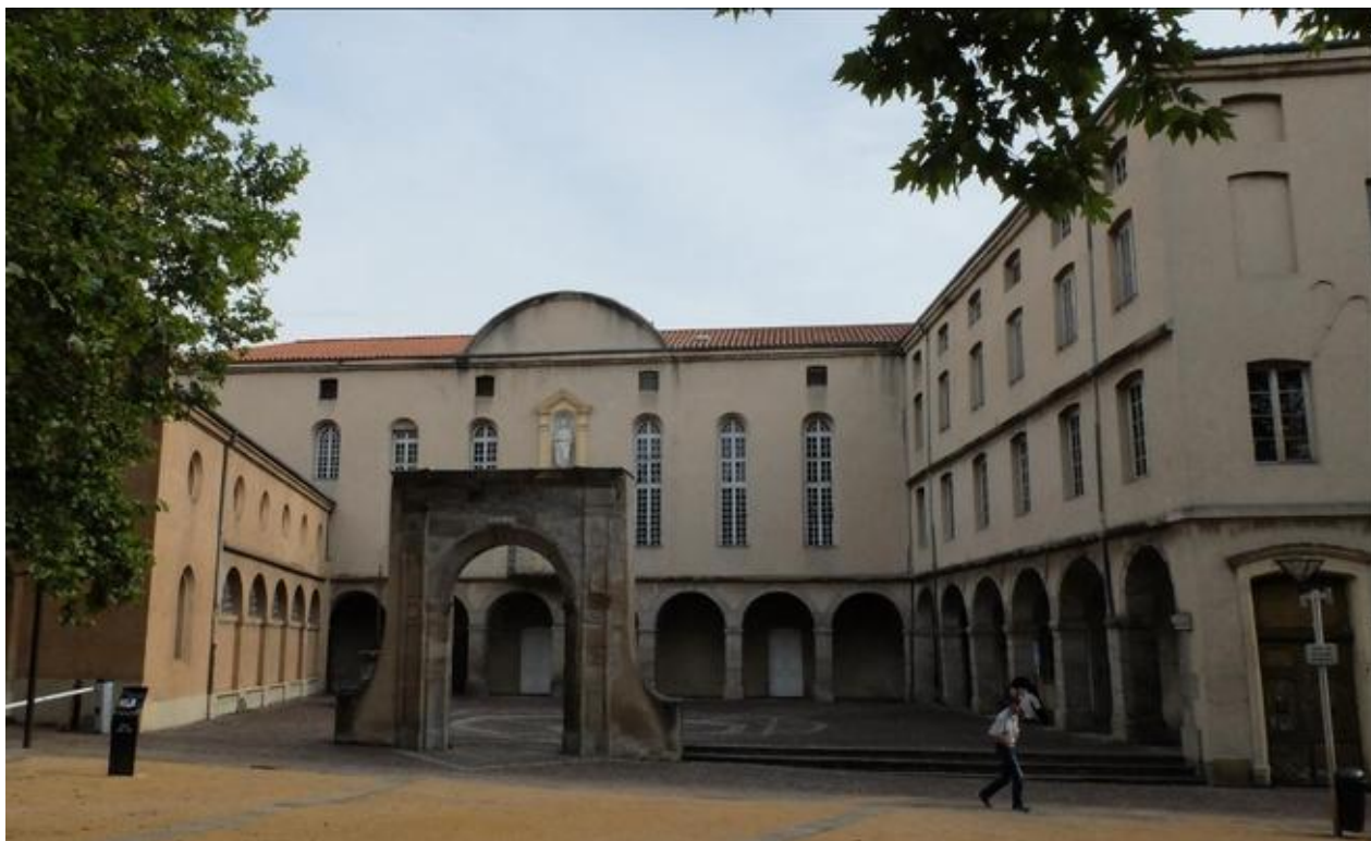
Hôtel-Dieu de Saint-Chamond, hospice où s'entassaient, en 1968, 20 à 25 vieillards malades dans une seule salle

Alors que j'avais connu une scolarité secondaire exclusivement masculine, je me retrouve seul garçon dans une classe de 21 élèves (on ne disait pas encore étudiants). Alors que je sortais d'études secondaires bien sages, dans un milieu plutôt protégé, je suis brutalement jeté dans la dure réalité de la vie... et de la mort. J'effectue en effet un an de stage à mi-temps en secteur hospitalier. En médecine hommes, je suis confronté à des fins de vie sordides. Nous nous prenons d'affection pour des petits vieux auxquels nous rendons visite à leur sortie, lorsqu'ils rejoignent l'hospice, installés dans une salle commune de 20 ou 25, qui empest l'urine et les produits désinfectants. Quelques fois nous assistons à leur enterrement dans les villages alentour. Je vois mourir de nombreux malades, qu'il nous faut conduire ensuite à la morgue.