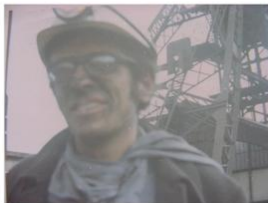
Puits Couriau à Saint-Etienne, dans lequel je descends avec un délégué CGT à la sécurité en juin 1969