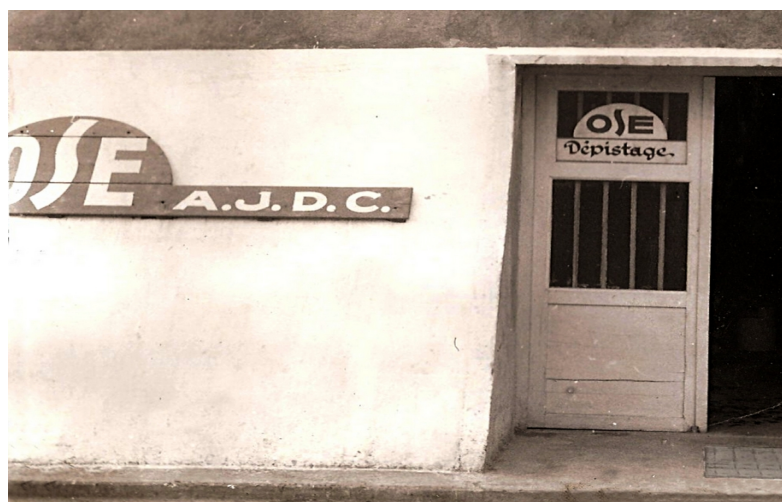
Fonds UNION OSE Marseille Personnes en transit 100. Entrée de la baraque du dépistage.

Marseille est l'un des hauts lieux de la mémoire juive de la Seconde guerre mondiale, véritable plaque tournante de l'émigration, qui a continué à jouer un rôle prédominant pour les transitaires vers la Palestine mandataire, puis Israël, jusqu'à la fin des années cinquante, avec l'Aliyah des marocains.