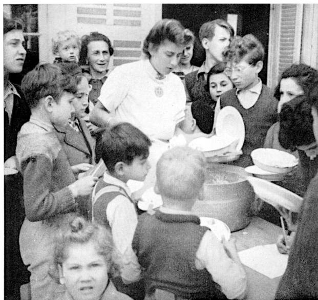
Non coté Fonds OSE Occupation 1940 1944 02. Camp de passage Bompard - Marseille 1942. Distribution du goûter aux enfants.

guerre, ses cadres d'origine russe sont progressivement relayés par les Juifs alsaciens.